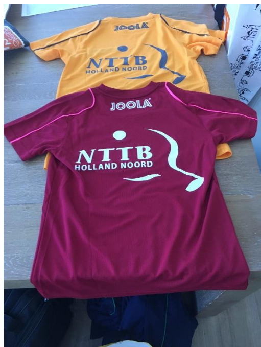
Foto: de afdelingstenues Jeugdcup 2018.

In 2018 was onze afdeling uiteraard ook weer aanwezig bij de NTTB Jeugdcup en de 4-afdelingenontmoeting en met diverse persoonlijke- en dit keer ook afdelingssuccessen.